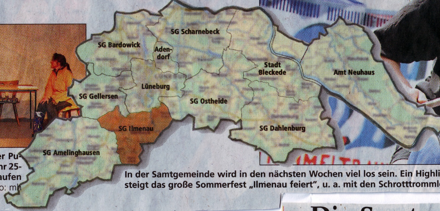
In der Samtgemeinde wird in den nächsten Wochen viel los sein. Ein Highlight: Am Sonntag, 1. Juni, steigt das große Sommerfest „Ilmenau feiert“, u. a. mit den Schrottrommlern.