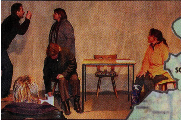
Proben beim Melbecker Puppentheater, das dieses Jahr 25-jähriges Bestehen feiert, laufen auf Hochtouren.